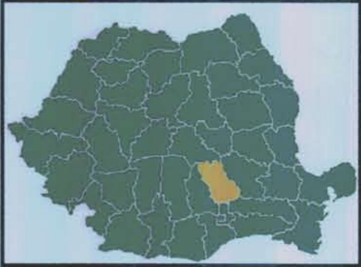
INCADRAREA JUDETULUI PRAHOVA IN TERITORIUL NATIONAL