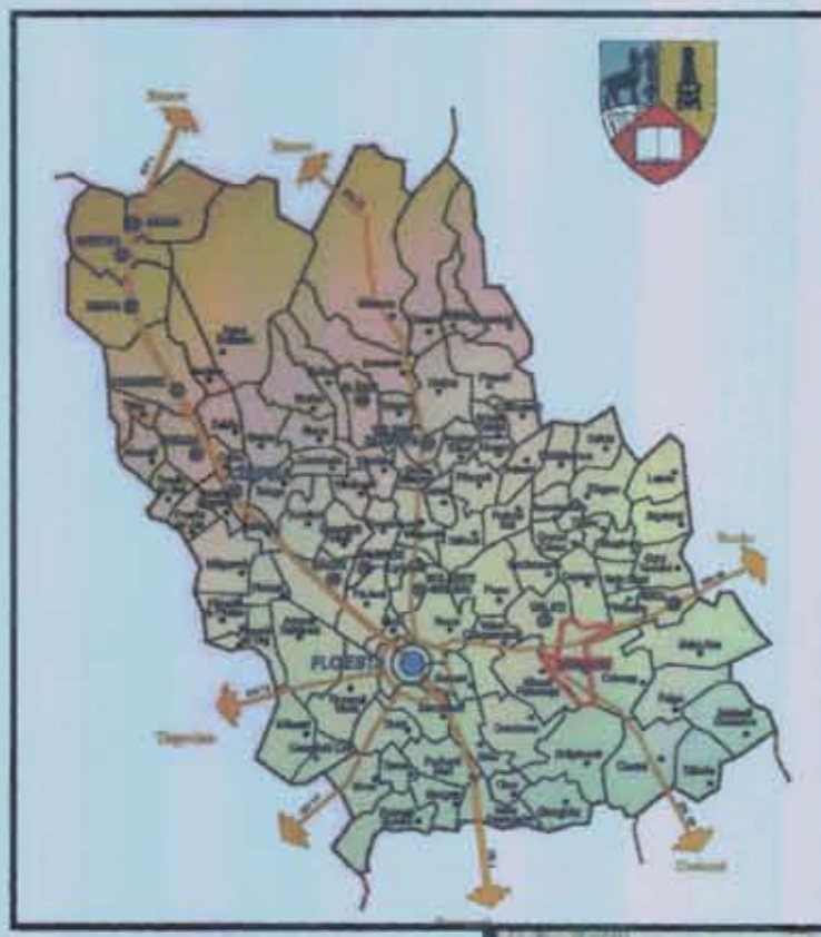
INCADRAREA COMUNEI TOMSANI IN TERITORIUL JUDETEAN PRAHOVA